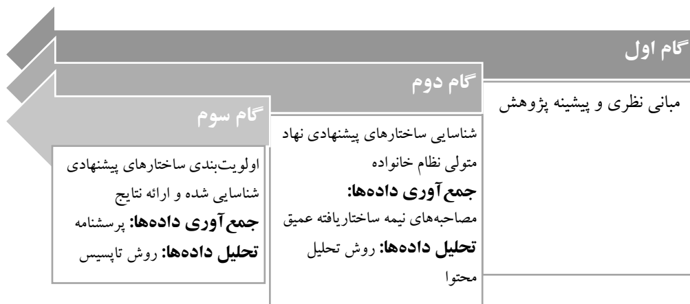
شکل ۲: مراحل انجام پژوهش حاضر