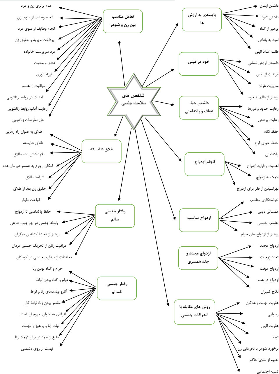
شکل ۱. شاخص های سلامت جنسی