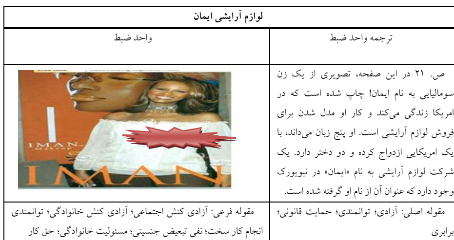
جدول شماره ۶: تحلیل محتوای درس ۳ کتاب ۱ امریکن هد وی

چند نکته مهم در این تصویر وجود دارد. ابتدا نام شرکت لوازم آرایشی است که از کلمه «ایمان» تشکیل شده و به نظر نمی‌رسد، تصادفی باشد. اینکه شرکتی به نام ایمان تشکیل و لوازم آرایشی تولید می‌کند، مفهومی نمادین دارد. انتخاب این شرکت از میان همه شرکت‌های تولیدی از طرف نویسنده با هدف تغییر هویتی است که امریکایی‌ها برای دیگر کشورهای غیرهمسوی خود دنبال می‌کنند. تلاش این است تا فرهنگ‌هایی که در رابطه با زنان از آموزه‌های دینی و فرهنگ بومی پیروی می‌کنند به رویکرد امریکایی متمایل شوند. این داستان که یک زن سومالیایی می‌تواند به امریکا آمده و پنج زبان یاد بگیرد و هم‌نام او شرکتی تأسیس شود، می‌تواند در کشورهای دیگر حاکی از رشد زنان در محیط فمینیستی امریکا باشد و بازتاب تحسین‌برانگیزی داشته باشد. نتیجه این کار می‌تواند جاذبه فرهنگی زیادی